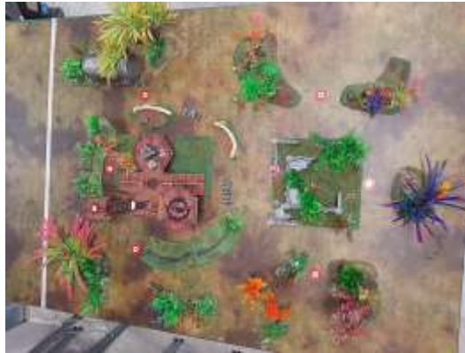
Mapa colocación escenografía

Misión: Tierra Quemada (Capitulo aprobado pág. 40)