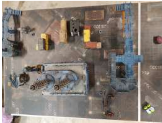
Mapa colocación escenografía

Misión: Barrido y limpieza (Capítulo aprobado pág. 52)